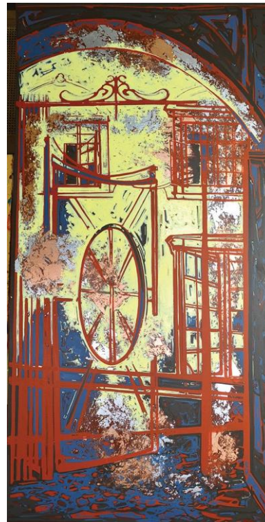
"Lviv's Gates," óleo sobre lino, 72 x 36 pulgadas

Taras Borovyk estará exhibiendo su obra en Agora Gallery en la exhibición Realidad Fragmentada desde el 12 de febrero hasta el 2 de marzo de 2016. La recepción de apertura, el 18 de febrero de 6 a 8pm estará abierta al público.