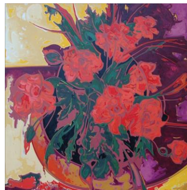
"Red Flowers" óleo sobre lienzo, 60 x 60 pulgadas