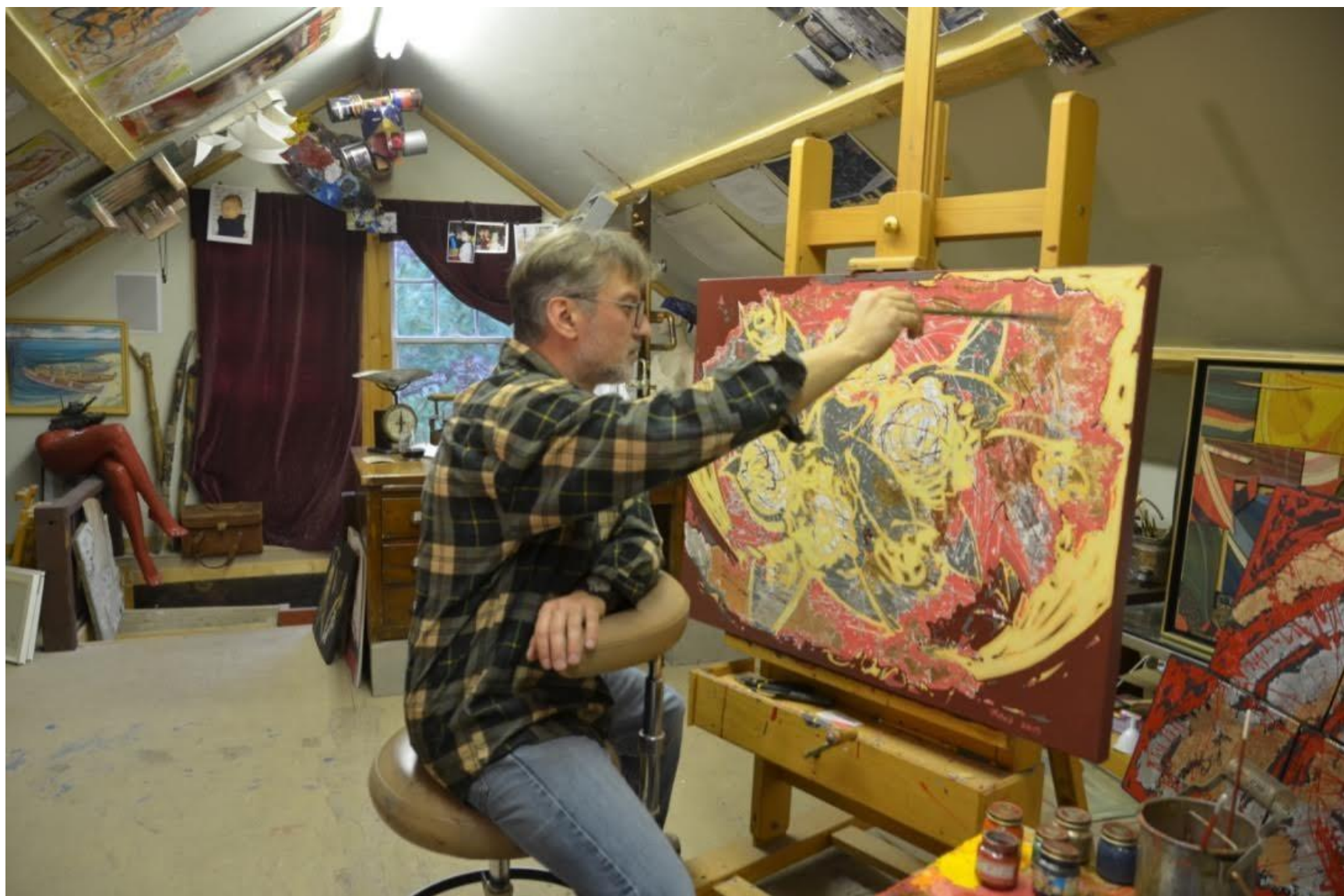
El artista en su estudio